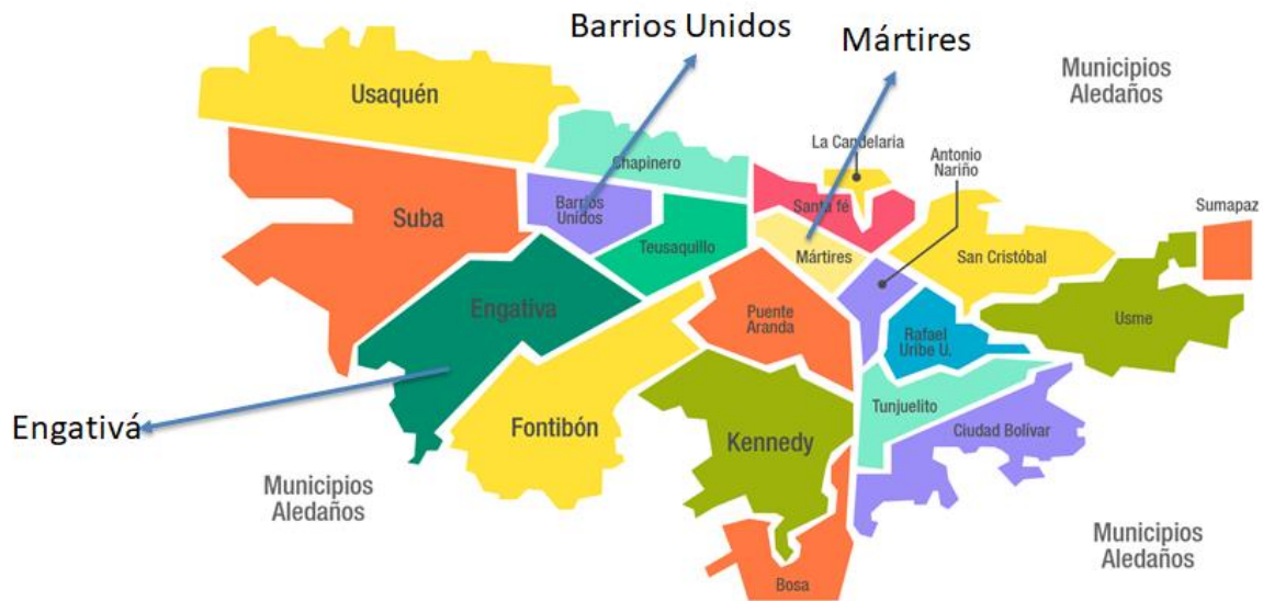
Figura 1. Localidades donde se ubican los nodos con accesibilidad a ANKLA-Tech